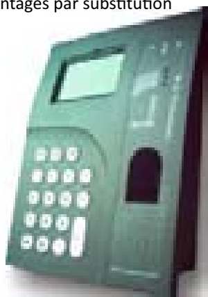
• Terminal Evolution 3Bio

Le terminal Evolution 3Bio peut aussi être utilisé pour le contrôle d'accès, en empêchant l'accès du personnel non autorisé aux bâtiments et les installations. Tous les mouvements à l'intérieur de zones critiques peuvent facilement être contrôlés et être enregistrés à base de données.