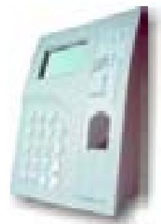
• Terminal Evolution 3Bio

L'Evolution Bio, est la meilleure solution sur le marché dans la relation qualité-prix.